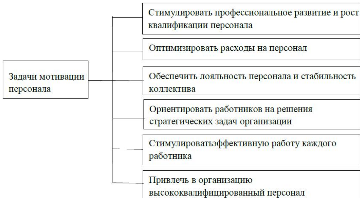
Рисунок 1.1 – Задачи системы мотивации персонала

Система мотивации ставит перед собой несколько задач, которые отражены на рисунке 1. 1.